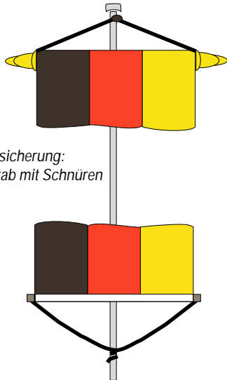
Sturmsicherung: Holzstab mit Schnüren